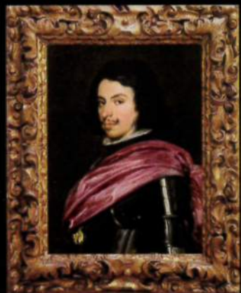
Diego Rodriguez De Silva y Velazquez, Modena, Galleria Estense

Nel ritratto del Velazquez, il Duca indossa un'armatura sulla quale scorre la fascia rossa di Generale degli Oceani, carica con cui Filippo IV l'onorò nel 1638. Nel suo soggiorno spagnolo fu anche nominato Viceré di Catalogna e poi Cavaliere del Toson d'oro, come indica il vello d'oro che pende dalla fascia.